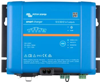
Smart IP43 Charger 12/50(1+1)