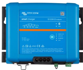
Smart IP43 Charger 12/50(3)