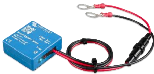
Bluetooth-tunnistus: Smart Battery Sense