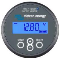
Bluetooth-tunnistus: BMW-712 Smart -akkumonitori